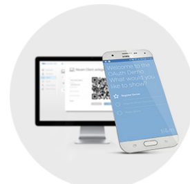
ti&m security suite