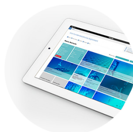
ti&m channel suite

Die Zukunft ist mobile, interactive und touch. Omnichannel-Commerce von ti&m mit höchster Agilität, Sicherheit und Innovationsgeschwindigkeit für B2B, B2C, B2E. ti&m hat 2015 rund 3,6 Mio.* CHF in den Produktausbau investiert: ti&m channel suite: 2,1 Mio.* CHF, ti&m security suite: 1,5 Mio.* CHF.